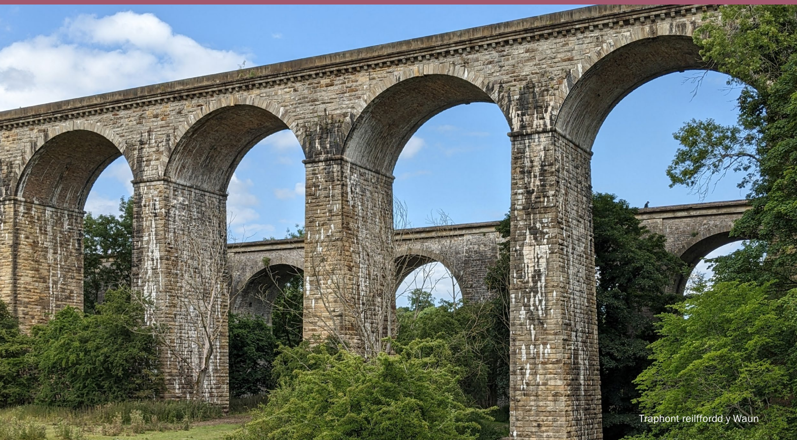
Traphont reilffordd y Waun